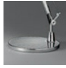
TOLOMEO BASE TV ALL D230 A004030